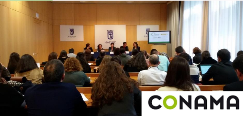
FORO ACCIÓN SECTORIAL POR EL CLIMA e INNOVACIÓN Y CIENCIA SECTORIAL CLIMATE ACTION and INNOVATION & SCIENCE FORUM